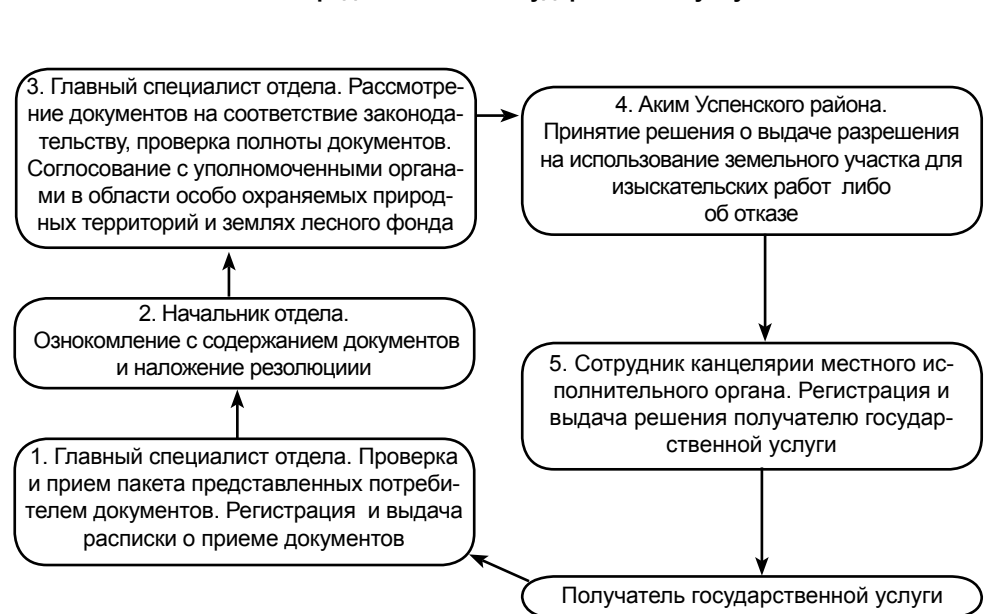
Схема предоставления государственной услуги

Приложение 1 к регламенту государственной услуги «Выдача разрешения на использование земельного участка для изыскательских работ»