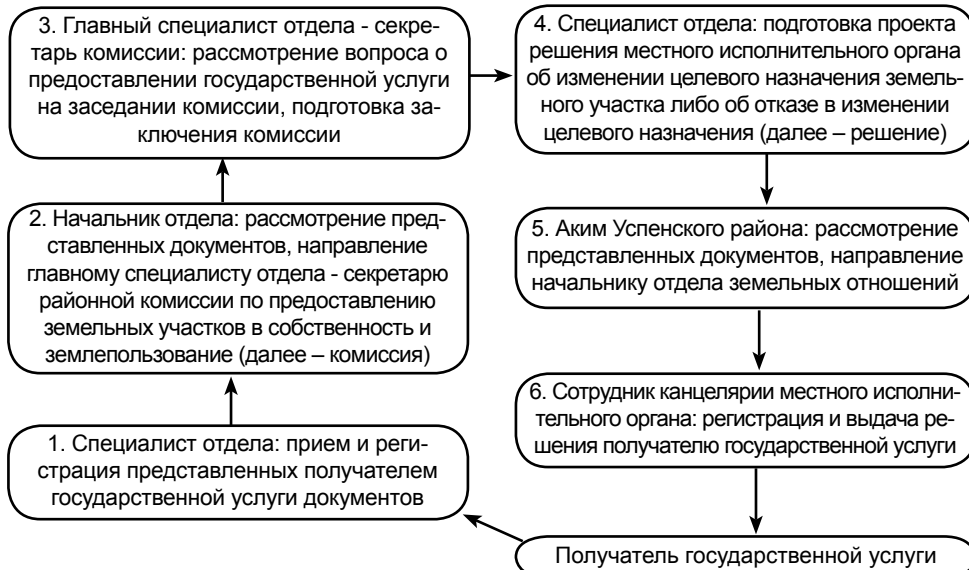
Схема предоставления государственной услуги

Утвержден постановлением акимата Успенского района от 30 января 2013 года №58/1